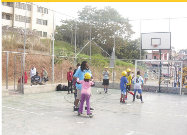
Terra Portugalense Travessa dos Bochimanos,