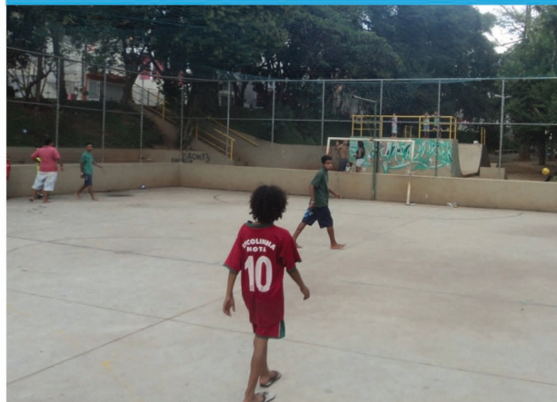
Avenida Andrea Pisano, 65