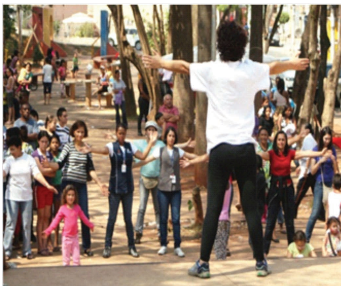
UBS realiza uma aula de vivência corporal chamando a atenção da importância de combater o sedentarismo.

Este evento pretende mobilizar a comunidade local para promover ações nos espaços públicos que proporcionem cultura, cidadania, atividade física e esportiva, além da prestação de serviço. Ao promover eventos no espaço público que congregam diversos interesses, o projeto dá visibilidade às muitas ações dos agentes locais confluindo os trabalhos para o espaço público, potencializando a apropriação das praças, quadras e ambientes coletivos comunitários.