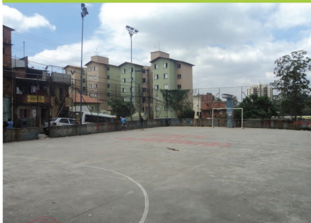
Rua Doutor Jose Augusto de Sousa e Silva, 203